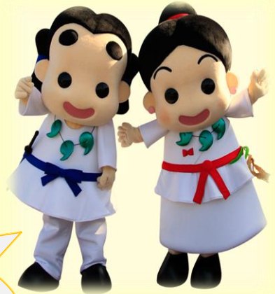
コダイくん ロマンちゃん 和泉市マスコットキャラクター