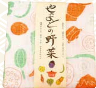
▲柄：大和なな、大和丸なす、大和三尺きゅうり、筒井れんこん、花みょうが、ひもとうがらし

1863年(文久3年)に創業された奈良にある奈良晒織元です。奈良特産の蚊帳生地を使用したふきんは、やわらかく優しい手触りで肌ふきに最適です。