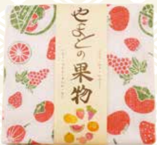
▲柄：いちご、柿、すいか、いちじく、みかん、ぶどう、なし