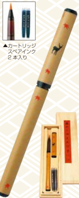
▲カートリッジスベアインク2本入り

軸に天然竹を使用し、一本一本、紋様も太さも手触りも微妙に異なります。竹軸に鹿と紅葉の柄を入れております。奈良筆の軸に使われる天然の紋竹をポディーに採用。穂先は筆職人が腰の強い人造毛を使い、細筆の工程で一本ずつ丹念に造筆しております。インクは、カートリッジ式なので繰り返し使用することができます。桐箱入りで贈り物にも適しています。