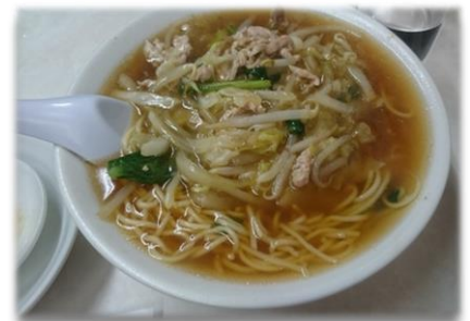
横浜・サンマーメン

中国の担々麺をヒントに作られた、塩ベースのスープに、にんにくと唐辛子が入り、具に溶き卵とひき肉が入る川崎のメチャ辛ソウルフード。