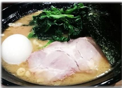
横浜・家系ラーメン

不動の人気を誇る家系(いえけい)ラーメンは、豚骨醤油ベースの濃い目のスープに、ストレートの太麺が特徴的。トッピングは、ノリ、チャーシュー、ほうれん草、白ねぎ。