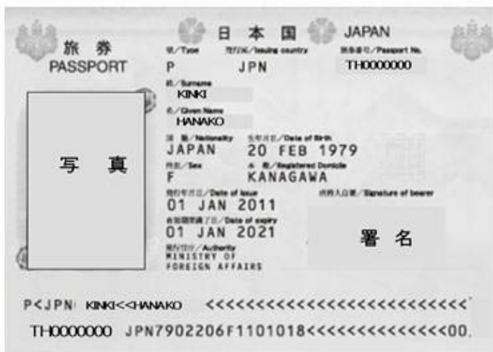
〔顔写真ページ見本〕 ↙