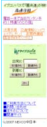
高速日和モバイル