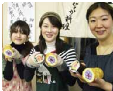
太巻き寿司作り体験