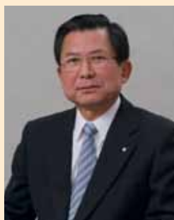
近畿日本ツーリスト株式会社 取締役社長