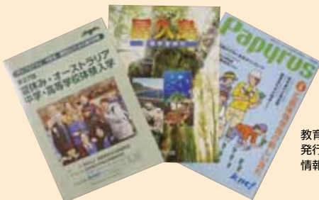
教育機関向けに発行している情報誌やパンフレット

ます。近年では地球環境の大切さを学ぶ「環境学習」、将来の進路の指針としての「キャリア学習」、地域の人々とのふれあいを通じた「体験学習」及び「平和学習」等数多くの企画提案を行い事業展開を図っております。