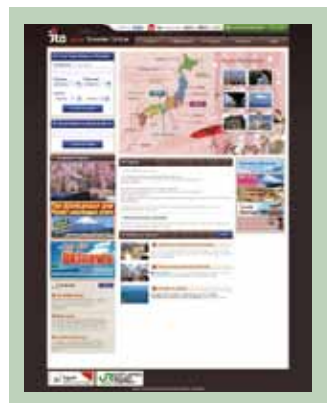
Japan Traveler Online