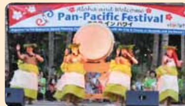
まつりインハワイ

企業の招待旅行や産業視察、職場旅行、メモリアルマーケティングに通じる周年記念イベントなどを全国規模でご提案。オリンピックや国体などのスポーツ関連イベントや博覧会の取り扱いでは豊富な実績があります。また、1980年にスタートしたイベント参加型ツアーの先駆けである「まつりインハワイ」は、現在は州の公認を受けるまでに成長し、この種のものでは世界的にも最大かつ最長の歴史を誇るイベントです。