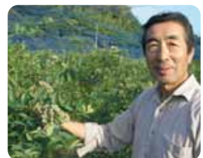
農園コテージでブルーベリーつみ体験

観光産業の担い手としての経験と全国ネットワークを活かし、地域の隠れた魅力的な観光素材の発掘や、プロモーション、観光プロデューサーの派遣など、地域の観光振興を応援します。また、KNTと角川グループで設立した株式会社ティール・ゲートでは、旅先での遊び方(体験・交流プログラムや着地型旅行)をテーマで検索し、予約から決済までワンストップでサービスする体験サイト「旅の発見」を運営しています。