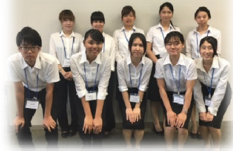
イベント企画した大学生の皆さま

このツアーは関西の大学生が、ツーリズムビジネス研修の中で「学生オリジナル旅行プラン(イベント)を企画・ツーリズムビジネスを成功させよ！」をテーマに京都府相楽郡精華町にてイベント企画されたツアーです。