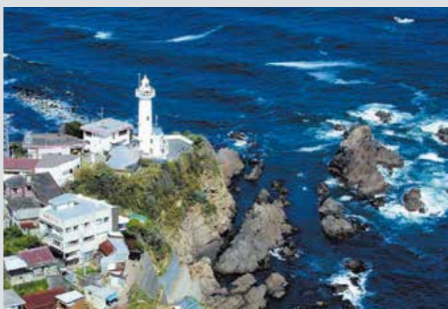
■岸壁の先端に立つ波切の大王埼灯台