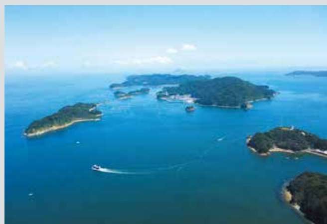
■鳥羽湾に浮かぶ島々