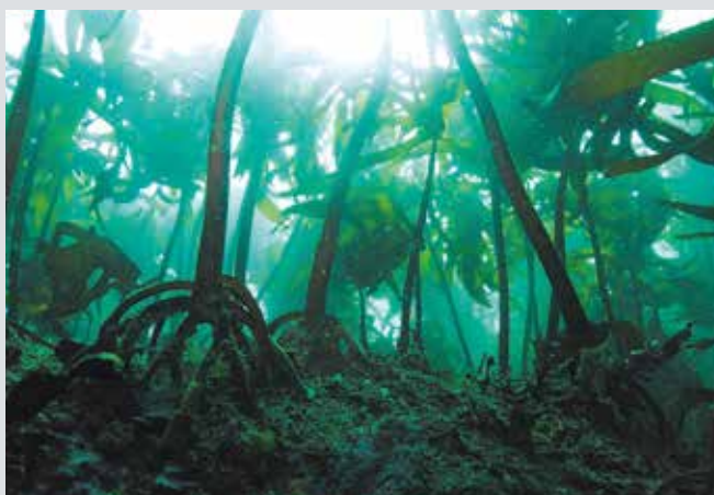
■海女の見える景色、海藻の森

ほかの国立公園に比べると、民有地の割合が96%以上と非常に高く、人の生活圏を多く含むため、伊勢神宮、海女漁、真珠養殖に代表される地域の生活、歴史、文化、風習に深くふれることができるのが特徴で、美しい景観を誇るとともに人と自然の関わりを感じさせてくれる国立公園です。