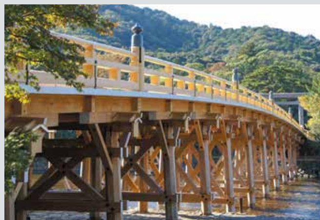
■内宮(伊勢神宮)の五十鈴川にかかる宇治橋