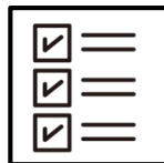
行動履歴、感染履歴の把握