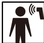
ツアー客、スタッフの検温の徹底