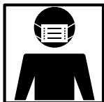
マスク着用の徹底

本オンラインツアーでは、新型コロナウイルス感染症対策を徹底して皆さまをお迎えいたします。 コロナ禍においても、お客様が安心して観光を楽しんでいただけるツアー商品づくりを実現します。