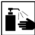
手洗い、手指消毒の徹底