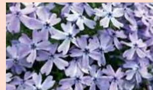
オーキントンブルーアイ