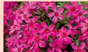
スカーレットフレーム