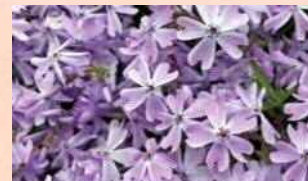
エメラルドクッション