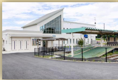
東松島市震災復興祈念伝承館