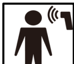
ツアー客、スタッフの検温の徹底