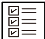
行動履歴、感染履歴の把握