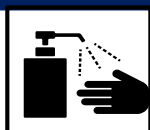
手洗い、手指消毒の徹底