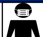
マスク着用の徹底