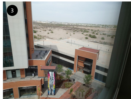
3 ホテル部屋(5階)から観測場所。 右が東方向です。遮るものは、ほぼありません。