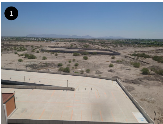
1 ホテルから観測場所。奥が東方向です。 遮るものは、ほぼありません。