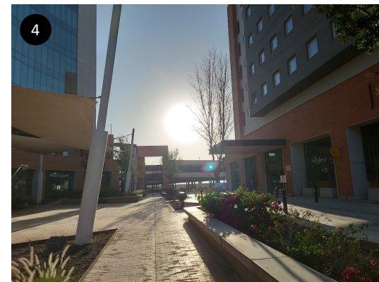
4 朝8時頃の太陽位置です。天気も快晴でした！