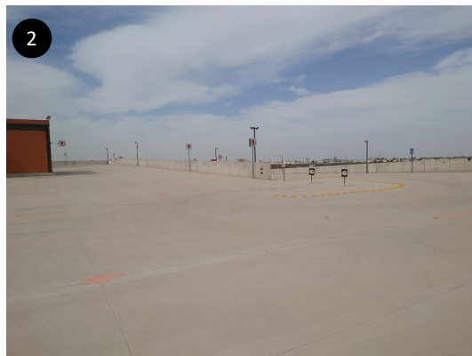
2 やや傾斜があります。 建物でいうと3階になりますが、エレベーターもあり、 重い機材も楽に運べます。