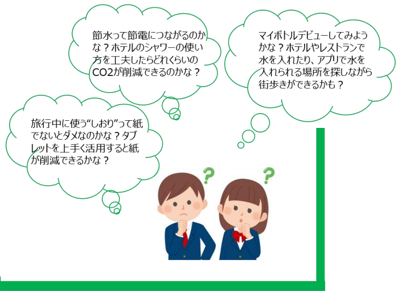
生徒が自ら考えた項目をBINGOに入れる

一連の学習の流れについて「カーボンスタディ」ワークキット利用のための説明オリジナル動画をご用意しています。