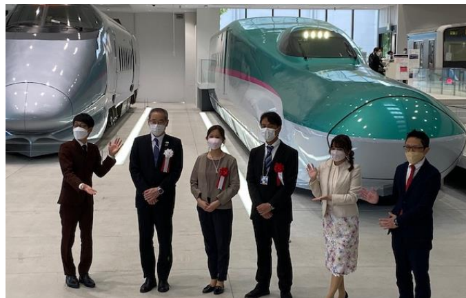
表彰式と記念撮影の様子

鉄旅オブザイヤーの「パーソナル部門賞(個人旅行)」は、往復鉄道を利用し、かつ着地の観光素材を活用し、当該地域への送客に貢献した個人旅行向け商品の中から選考されます。 本商品は、人気列車「伊予灘ものがたり(道後編)」をはじめとし、3日間で四国の人気観光地である高松・高知・道後を周遊でき、5つの列車に乗車し、四国を満喫することができる鉄道好きにはうれしい企画である点が評価され受賞となりました。審査員からも「ツアーならではの便利さ」と「自分だけの旅を創る自由さ」のバランスがとてもよい、とのコメントもいただきました。