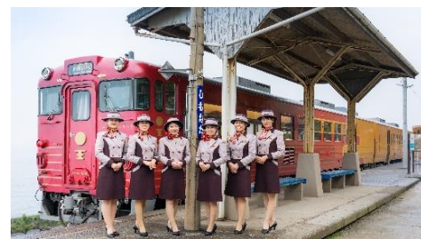
伊予灘ものがたり (2021年下期車両)