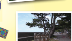
全て夫婦岩参道イメージ(A80)