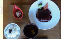
松阪牛ハンバーグ定食イメージ(P57)