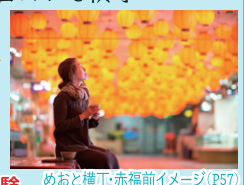
めおと横丁・赤福前イメージ(P57)