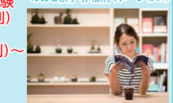
めおと岩カフェイメージ(P57)